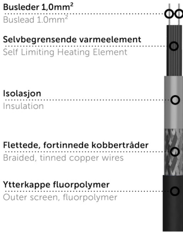
Kabelsnitt / cable cross section