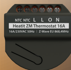
HEATIT ZM THERMOSTAT