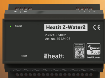
HEATIT Z-WATER2 Vannbåren varme