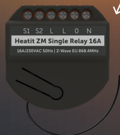
HEATIT ZM SINGLE RELAY Varmekabler