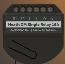
HEATIT ZM SINGLE RELAY Takvarme