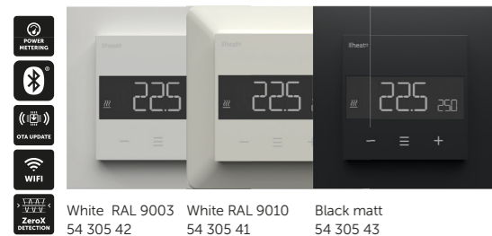
White RAL 9003 54 305 42 White RAL 9010 54 305 41 Black matt 54 305 43